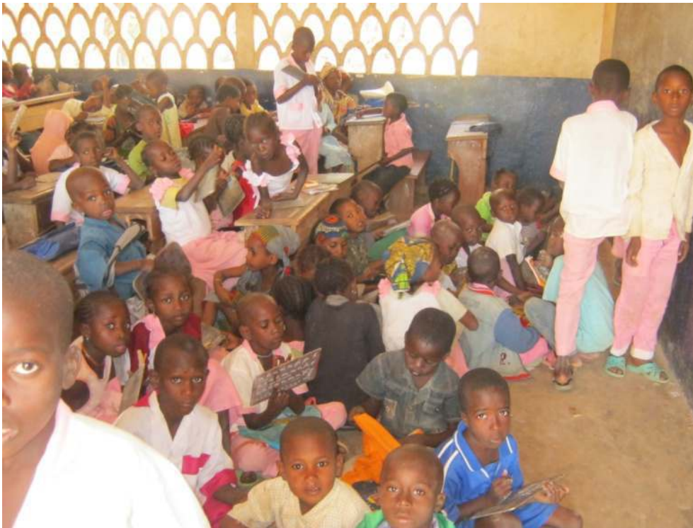
Photo 2. Une salle de classe pléthorique de l'École Publique de Mandjou I