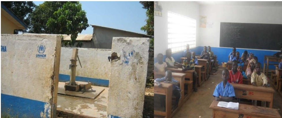
Photo 1. Équipements en eau et salle de classe aux couleurs et logos du donateur, l'UNHCR