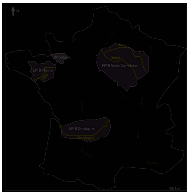
Figure 1. Localisation des quatre territoires étudiés en France métropolitaine

Réalisation : Alexis Metzger, James Linton ; juin 2016.