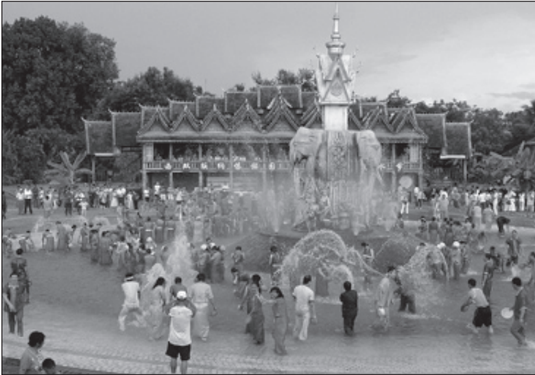
Figure 3. La fête de l'eau, à l'origine un rituel annuel, est célébré deux fois par jour dans le village Dai en Chine près de la frontière du Myanmar